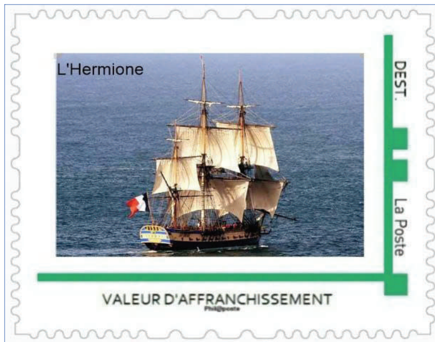
La frégate L'HERMIONE sous voiles, objet du MtaM