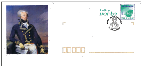
Prêt à poster

DEMERGES Eliane 24 avenue du 8 mai 1945 17730 - PORT DES BARQUES