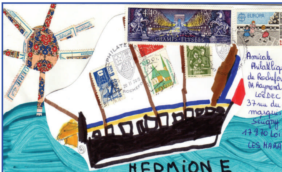
Deux réalisations d'art postal, maternelle Champlain à ROCHEFORT