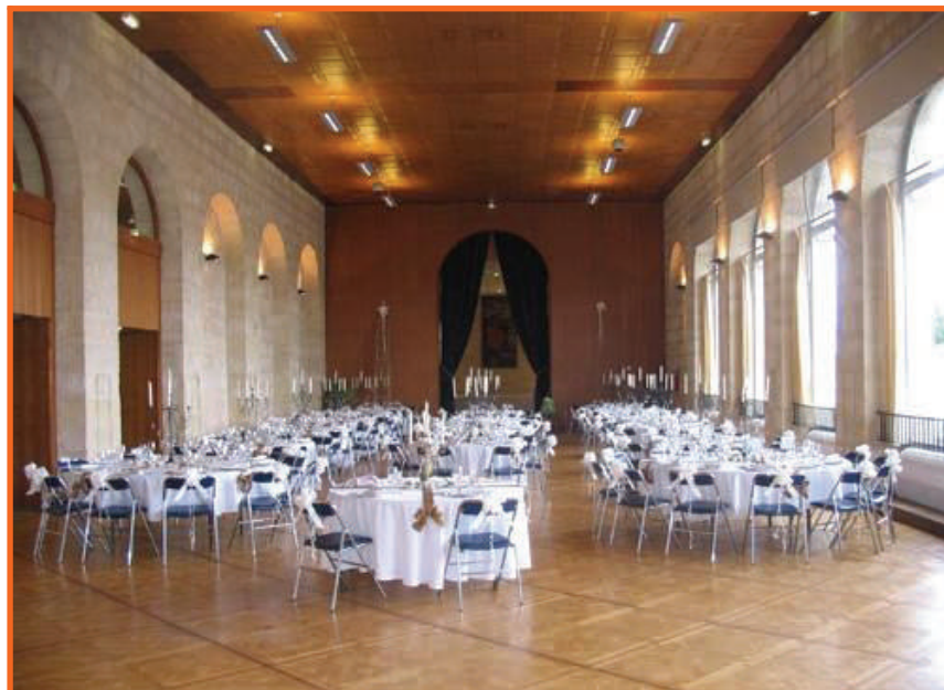
La salle du palais des congrès où s'est tenue l'exposition (les tables, c'est pas nous...)

Vendredi 6 mars, 6 heures 35 ; dans la froideur hivernale un petit groupe avance. L'allure est martiale, les encolures puissantes, les épaules musculeuses, les bras velus. Des bêtes de concours, des sportifs de haut niveau ; la dream team de l'amicale de ROCHEFORT va à pied d'œuvre mettre la salle COLBERT du palais des congrès en configuration exposition.