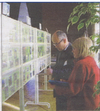
Le jury passe noter les expositions.

Les Rochefortais n'avaient plus eu droit à la manifestation depuis 1977. Ce week-end, après trente-huit ans d'absence, le congrès régional du centre-ouest de philatélie a pris ses quartiers au Palais des congrès, grâce à l'organisation de l'Amicale philatélique rochefortaise. Pour cette exposition qui tourne chaque année dans le grand Ouest et que se partagent 33 clubs de philatélie, pas moins de 22 jeunes et 35 adultes exposaient sur 86 panneaux. Les thèmes retenus par les passionnés allaient de l'histoire postale à la classe ouverte en passant par les fleurs et les animaux. L'art postal n'était pas oublié grâce à un travail des écoles et