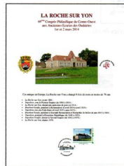
Souvenir A4, 4 pages qui raconte l'Histoire du Château des Oudairies