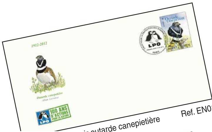
Enveloppe souvenir outarde canepetière