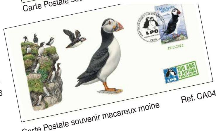
Carte Postale souvenir macareux moine