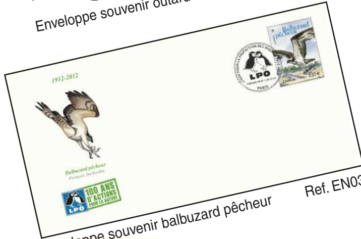
Enveloppe souvenir balbuzard pêcheur