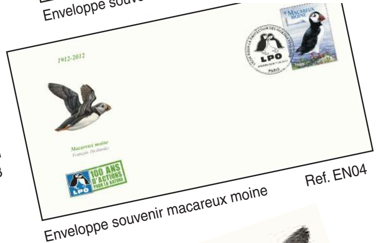
Enveloppe souvenir macareux moine