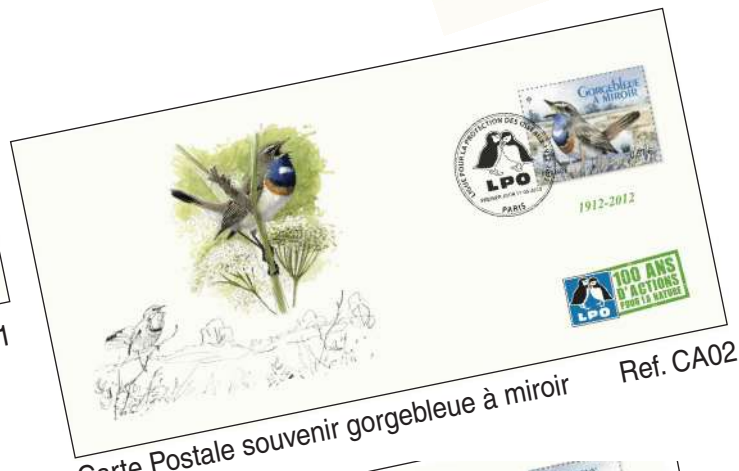
Carte Postale souvenir gorgebleue à miroir