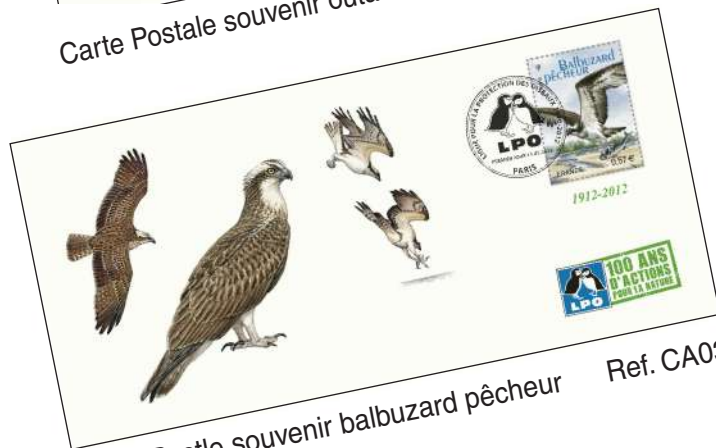
Carte Postale souvenir balbuzard pêcheur