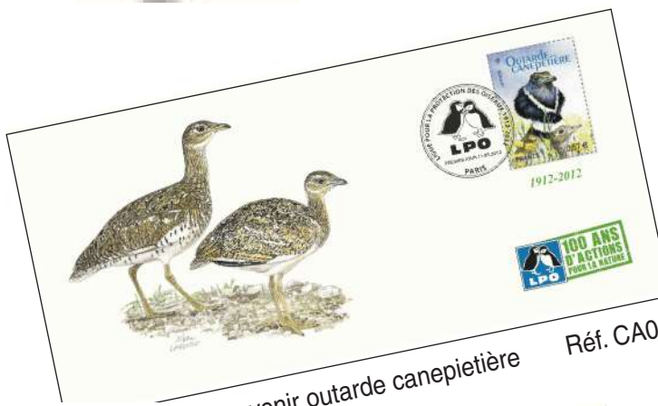
Carte Postale souvenir outarde canepetière