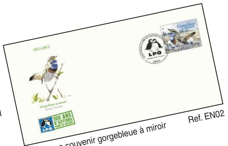
Enveloppe souvenir gorgebleue à miroir