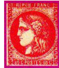
49b ROSE FONCE TERNE