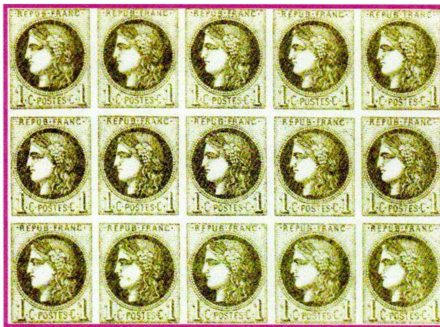
Bloc-report de 15 valeurs du 1 c. n° 39 report 1

Ils sont intéressants sur journaux, ce pourquoi ils ont été émis.