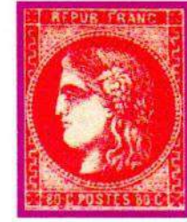
49a ROSE CLAIR