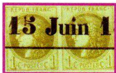
Paire du 1 c. oblitération typographique