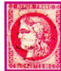
49c ROSE CARMINÉ