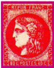
YT 49 ROSE