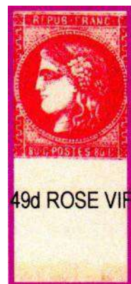
49d ROSE VIF