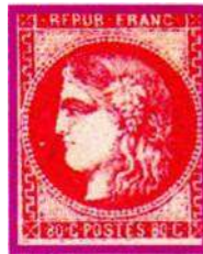
49h ROSE FONCE VIF