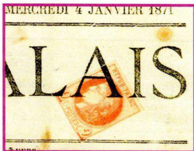
2 c. n° 40 report 1, brun-rouge.