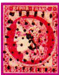
49 ROSE LIE DE VIN