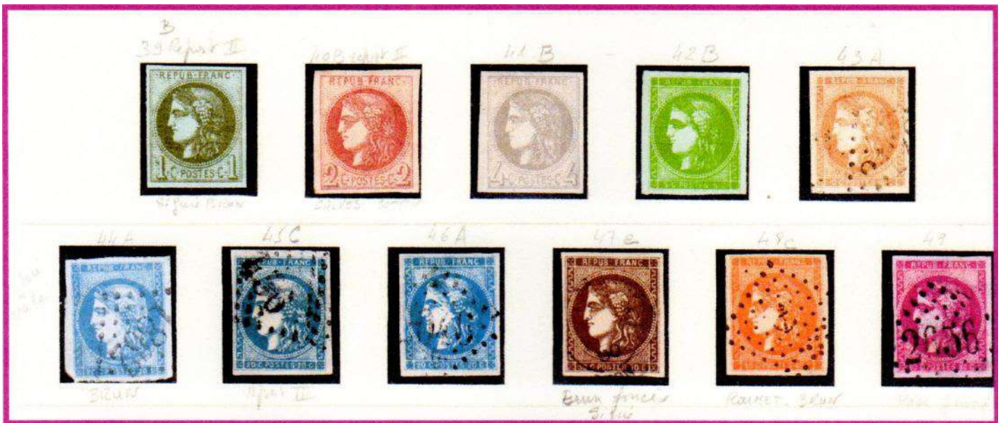
RÉPERTOIRE DES ONZE NUMÉROS 39 À 49

L'effigie est au type CÉRÈS , timbres non dentelés, les valeurs correspondent aux tarifs en cours. 1, 2, 4 et 5 centimes pour les journaux et les imprimés. 10, 20, 30, 40 et 80 centimes pour les lettres locales, de bureau à bureau, pour l'étranger (30 c.)