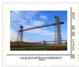
Timbre à l'unité