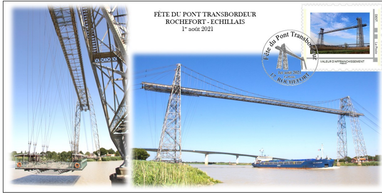
Carte postale longue 21 x 10